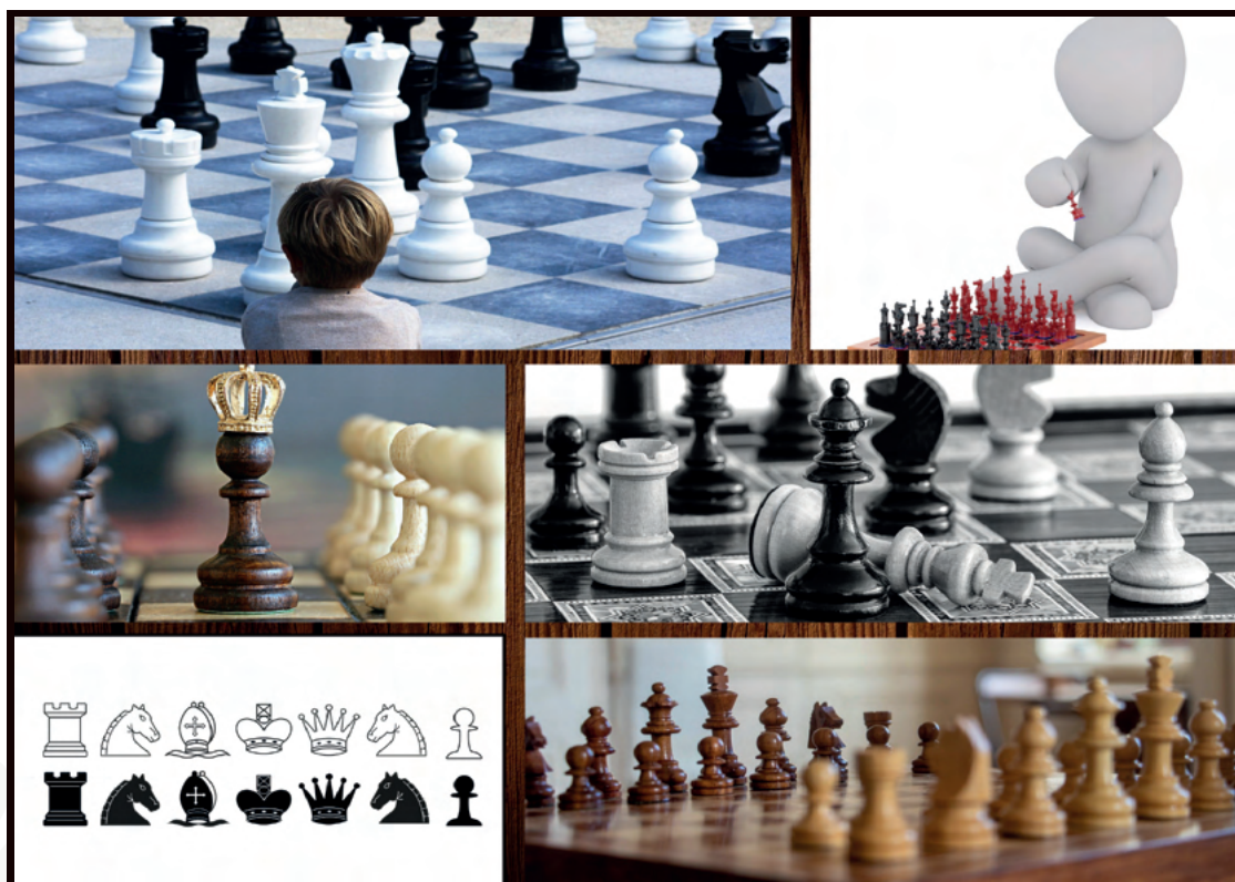
Figury szachowe: konik , wieża, gонец, król, królowa, pionek